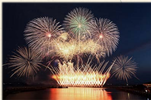
『長浜花火 オープニング スターメイン』

滋賀県産の此処ならではの花火を創るべく、花火の燃えカスの極めて少ない綺麗な花火を開発し、平成20年から昨年までに数々の賞を頂き、諏訪湖新作花火では準優勝を頂くことができました。また、「濃い青色花火」の開発に成功し、イメージ名『ここに咲く紫陽花の華(青い花火)』を発表した2年前に、秋田県大曲新作花火コレクション：銅賞、諏訪湖：長野県知事賞、更に今シーズン7/15の伊勢神宮奉納全国花火大会でも「佳作」に入賞するなど多くの舞台上で滋賀県産の花火を広くPRすることが出来、先代、先々代の恩に報いることができたかと思えます。