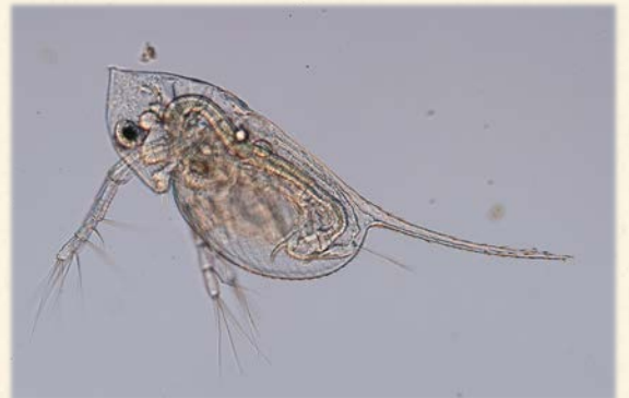
『カブトミジンコ』(琵琶湖でもよく見られるミジンコ。頭部の棘が中世の兜のように見えるのが由来である。)

ヨシ帯は水中のリンや窒素を吸収し、それを人が刈り取ることで、水質浄化に役立つというのは有名な話です。そして、実はその水質浄化の一翼を微小生物たちも担っています。夏場、ヨシの表面を良く見てみると、何やらモヤモヤしたものがたくさん付着しているヨシが見つかります。そのヨシを採集して顕微鏡で拡大してみると、ヨシの隙間を泳ぐプランクトンや表面に付いたペリフィトン、根元やミドロの森をかけるベントスなど、たくさんの微小生物たちが生活しているのが見つかります。彼らこそが、水中の掃除屋です。カイミジンコやミズズの