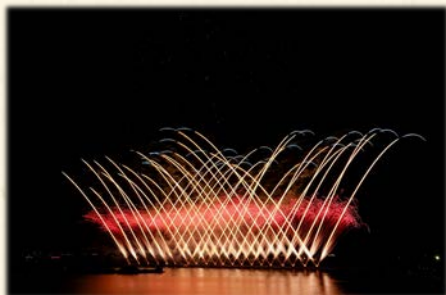
『長浜花火 デジタル旋風』

滋賀県産の此処ならではの花火を創るべく、花火の燃えカスの極めて少ない綺麗な花火を開発し、平成20年から昨年までに数々の賞を頂き、諏訪湖新作花火では準優勝を頂くことができました。また、「濃い青色花火」の開発に成功し、イメージ名『ここに咲く紫陽花の華(青い花火)』を発表した2年前に、秋田県大曲新作花火コレクション：銅賞、諏訪湖：長野県知事賞、更に今シーズン7/15の伊勢神宮奉納全国花火大会でも「佳作」に入賞するなど多くの舞台上で滋賀県産の花火を広くPRすることが出来、先代、先々代の恩に報いることができたかと思えます。