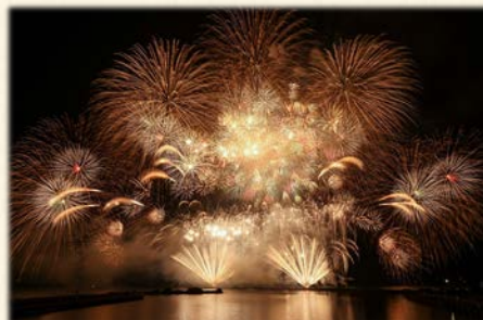
『長浜花火 最終 スターメイン』