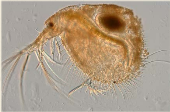
『ケブカミジンコの仲間』(水底を這うように移動する。)

琵琶湖をはじめとして、水田や溜池、河川、沼、苔の中など、さまざまな身近な場所にたくさんの微小生物たちが暮らしています。微小生物たちはよく「プランクトン」とひとまとめにされがちですが、実はプランクトンだけではないのです。このプランクトンと言う分類は、生きものを「生活様式で分けた分類のひとつ」で、水の流れに逆らえない浮遊生物を指す言葉です。そのため、微小であるかどうかは実は無関係だったりします。例えばエチゼンクラゲの様な1メートルを超すプランクトンもありますし、逆にツリガネムシの仲間の多くは0.1ミリメートル以下で微小ですが、何かに張り付いて生活しているので、ペリフィトン(付着生物)と呼ばれます。他にも水底を這いまわる生きものをベントス(底棲生物)と言い、イタチムシや一部のワムシ、ミズなどが含まれます。水の表面で生活する生きものはニューストン(水表生物)と言い、アメンボや一部のミジンコが含まれたりします。生活様式で分けるので、例えばミジンコの仲間の中でも、ベントスのケブカミジンコ、ニューストンのアオムキミジンコ、プランクトンのカブトミジンコと言ったように、さまざまに呼び方がわかるのです。