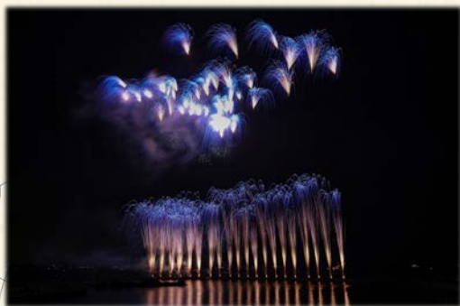
『青い花火 (ブルーインパルス青い衝撃)』

継ぐと決めましたが、世間では三代目が『ヤバイ』と言われていましたので、とにかく修行に行って他社の花火や最新の演出方法などを基礎から学ばないと変革の時代に対処できずに倒産は明らかです。そこで、修行先を探し、静岡の大手の花火業者に5年お世話になりました。そこでの多くの経験が今日の私を作ってくれたのです。