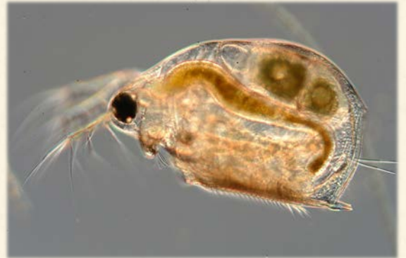
『タイリクアオムキミジンコ』(水面に張り付くように泳ぐため、殻の腹側が平らになっている。)