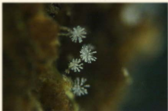
『琵琶湖から記載されたツリガネムシ、アポカルケシウムロゼッタム』