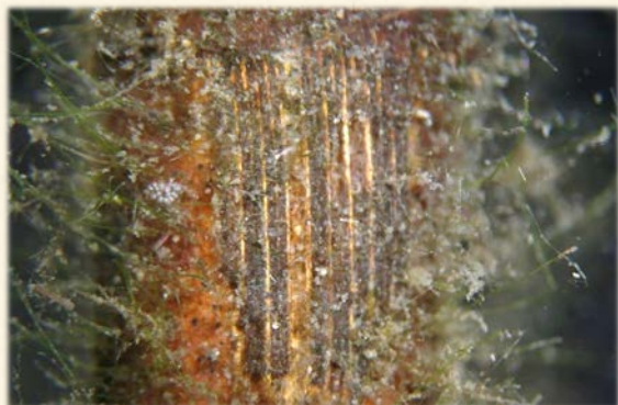
『さまざまな生物が付着したヨシ』(一見ゴミが着いているようだが、ほとんどが生物である。)

ヨシ帯は放置されると徐々に土が溜まり、他の植物が繁茂し、失われていってしまいます。ヨシ刈りなどを行い、しっかり手入れをし、ヨシ帯を維持することで、水質浄化だけでなく、多くの生物に生活の場を与え、生物多様性を守ることもつながるのです。