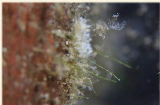
『ヨシ表面のツリガネムシたち』(ヨシの表面をジャングルのように覆っている。)