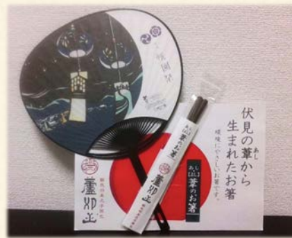
『祇園祭のうちわとヨシの箸』