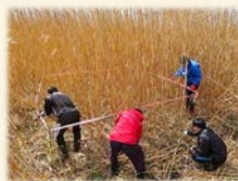
『 3×3mのプロットを決め 』

数年の調査のデータからヨシ刈りの必要性和 ヨシ原の環境効果を科学的に実証していきます。