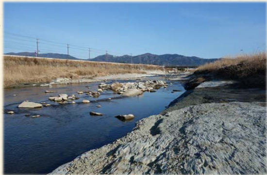
『伊賀市を流れる服部川の河原からは 370～350万年前の化石が発見される』

太古の琵琶湖やその周辺の様子は、大昔のそうした場所に泥や砂がたまってできた地層を見つけ、その中の化石を取り出して調べればわかります。ちょうど地層は分厚いノートや本のようなもので、その中に書かれている文字が化石に相当します。本を開いて中に書いてある文字を読めば当時の様子がわかるのです。古い時代のことは本の最初の方に書いてありますし、新しい時代のことは本の終わりの方に書いてあります。琵琶湖の歴史は440万年なので、440ページの本にたとえることができますが、かなり厚い本であることがお分かりになると思います。