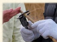
『 太さはどれくらい？ 』