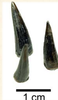
『360万年前の琵琶湖 にいたワニの歯の化石』