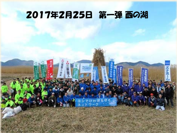
2017年2月25日 第一弾 西の湖

パナソニックエコリレージャパン びわ湖エコアイデア倶楽部 (株) パナホーム滋賀 琵琶湖博物館 澤本印刷所 京セラ (株) スミ利文具店 東田電機産業 (株) 三菱重工工作機械 (株) 旭化成住工 (株) (株) ダイフク