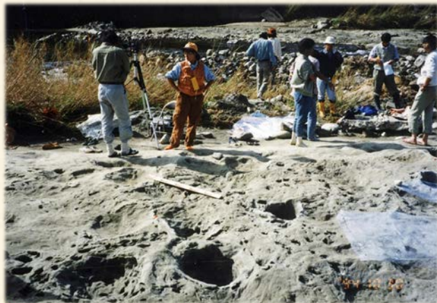
『370万年前の地層から発見されたゾウとワニの 足跡化石。小さなくぼみがワニの足跡化石』

本に書かれた文字を読むには技術が必要です。欧米の人が私たちの使っている漢字やひらがなを見てもひとつも意味がわかりません。わたしたちは、学校で何年もかけてようやく漢字が読めるようになりますが、同じように化石の研究をするためには何年も専門の勉強をして、やっと化石が語っていることを理解できるようになります。私は、骨や歯の化石を専門としていますが、この研究をするために大学では地質学を学び、卒業してからは解剖学教室に就職して骨や歯、筋肉や神経などの勉強をしました。そして、今は琵琶湖の周辺から見つかったひとかけらの歯や骨の化石を調べるために、国内各地の博物館や研究施設をめぐることはもとより、必要があれば海外にも行ってすでに発見されている標本との比較も行ったりもします。このようにして、太古の琵琶湖やその周辺にいた生き物たちの様子が一歩ずつわかっていきます。