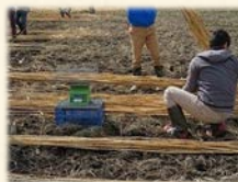
『 重さを測定中 』