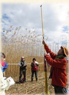
『 高さは？ 』