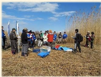
『 調査方法の説明を聞くメンバー 』