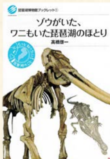
『琵琶湖博物館ブックレット ① として太古の琵琶湖にいた 動物の話が出ています』 (サンライズ出版)