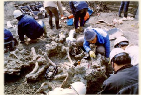
『1993年に行われた多賀町 アケボノゾウの発掘』

琵琶湖の周りから見つかるゾウ化石には、ミエゾウ、アケボノゾウ、ムカシマンモスゾウ、トウヨウゾウ、ナウマンゾウと時代のうつり変わりに伴って5種類も発見されています。このうち、最も新しい時代のゾウはナウマンゾウで約3万(円)年前まで琵琶湖の周辺で生きていました。私たちの一生は、せいぜい100(円)年程度ですので、あまり遠い昔のことも、ずっと先の未来のことも考えることはできませんが、“わずか”3万年前までは今の琵琶湖とはまったく違う世界が広がっていたことを、化石たちは教えてくれます。この時代には、地球規模の非常に寒冷な時代が訪れはじめた時代で、森の木の種類も変化し、温帯の気候に適したナウマンゾウは国内から次々に絶滅してしまいました。やがて、1万5000(円)年前になると急速に温暖な気候が訪れましたが、もうこの頃には日本列島にはゾウは一匹もいなくなっていました。そして、植物や動物などの自然の様子は、今、私たちが知っている近い状態になっていったのです。長い時間の流れの中で見ると自然はダイナミックに移り変わっていきますが、それに比べると私たちの生きている時間はマバタキにも似た一瞬にすぎないので、化石たちが教えてくれる大きな自然の変化にはなかなか気づかないのです。