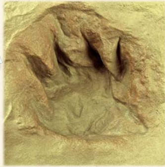
『370万年前のワニの足跡化石』 (琵琶湖博物館所蔵レプリカ)