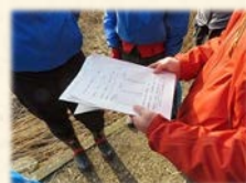
『 データの整理 』