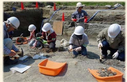
『最近でも多賀町では一般市民を 中心にした発掘が行われている』