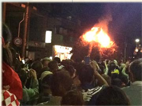
『三栖神社(神幸祭のたいまつ)』

文化・伝統的面については、伏見にて1700年頃の起源とされる三栖神社で行われる神幸祭は京都三大火祭りのひとつです。毎年10月に開催されるこの神幸祭ではヨシで作られた直径1.2m、長さ5m、重さ1tのたいまつに火を灯し、街中をねり歩きます。そして謡曲「芦刈」、祇園祭の芦刈山、平安時代からの雅楽に使用されている箆（ひちりき）のリードにもヨシが使用されています。また近代小説には谷崎潤一郎「芦刈」に巨椋池が記述されています。