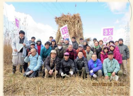
『2月12日の宇治川ヨシ刈り』

従来から主にヨシは文化財の屋根材に使用するため、地元業者がヨシ刈やヨシ焼などの地道な維持保全を長年に渡り行っていました。しかし、2010年にはヨシ焼が廃棄物処理にあたるとして行政から禁止の事態となりましたが、市民の環境保全活動が活発となり2013年にヨシ焼が復活したのです。併せて2015年頃から伏見地域活性化の環境テーマとして「宇治川のヨシを守るネットワーク」が設立され、今年2月12日には3回目となるボランティアによるヨシ刈を行うことができました。