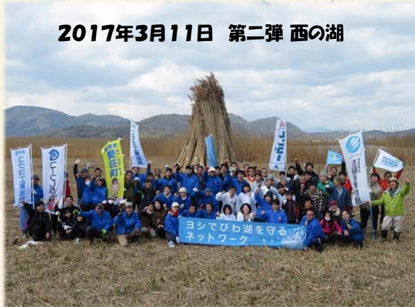
2017年3月11日 第二弾 西の湖

琵琶湖博物館 (株) ノエビア コープしが パナソニックエコリレージャパン びわ湖エコアイデア倶楽部 澤本印刷所 東田電機産業 (株) レンゴウ (株)