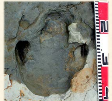
『370万年前の地層から発見 されたサイの足跡化石。 三本の指が確認できる』