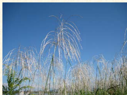
『ヨシに酷似しているオギ』

ヨシ条例やラムサール条約湿地の拡大(2008年)など、ヨシ群落は安泰かに見えましたが、冬になると抽水域のヨシは株元に荒波を受けて弱ってしまいます。また、保全という名のもとに刈らず、焼かずに放置するとヨシの枯葉の堆積により土壌の乾燥化が進み、ヨシに酷似したオギやセイタカアワダチソウ、ヨモギ、ツル植物などが繁茂してヨシ群落の勢力は衰えていきます。さらに近年、拡大阻止のために駆除に取り組んでいるミズヒマワリやナガエツルノゲイトウをはじめ、ヨシの株元を覆い尽くすオオフサモ、チクゴズズメノエ、ホテイアオイなど、外来植物も脅威となってきました。