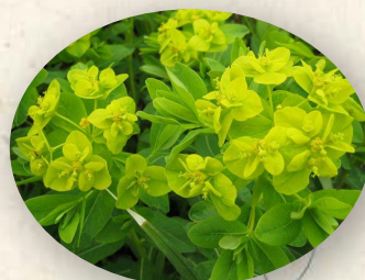
伊庭内湖のノウルシ

※※ 茎を切ると出る乳液が肌につくと“かぶれる”ことからこの名が付いているそうです。