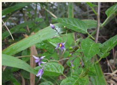
『オオマルバノホロシ』*