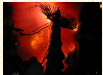
『近江八幡市 篠田神社の火祭り』