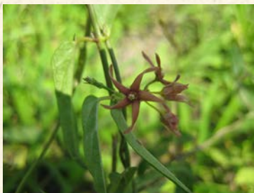
『ユバノカモメヅル』*

琵琶湖や内湖の水位は年間を通して管理されていますが（+30・-20cm）、大雨や濁水時にはさらなる水位変動が生じるため、隣接するヨシ原は人が容易に踏み込めない所です。この不安定な湿地に目をやると、一見ヨシだけが生育しているように見えますが、実はそうではありません。