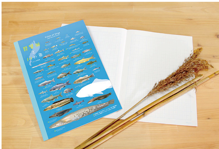
写真:「滋賀のお魚ヨシノート」

7月4日・5日に滋賀県立琵琶湖博物館(滋賀県草津市)で開催される「びわ博フェス2015」を皮切りに、館内の売店で販売します。また、滋賀県内の主要文具店はじめ観光地のお土産売り場等で販売します。