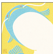
ビワコオオナマス

ビワコオオナマスやヨシ原、滋賀県の県鳥カイツブリなどの絵柄が印刷されたヨシ紙のメッセージカードです。琵琶湖・淀川水系のヨシ紙を使用しており、風合いがあります。ヨシの活用は、水質の浄化や生態系保全など琵琶湖の環境維持につながります。また、売上の一部をヨシ群落の保全活動に役立てます。