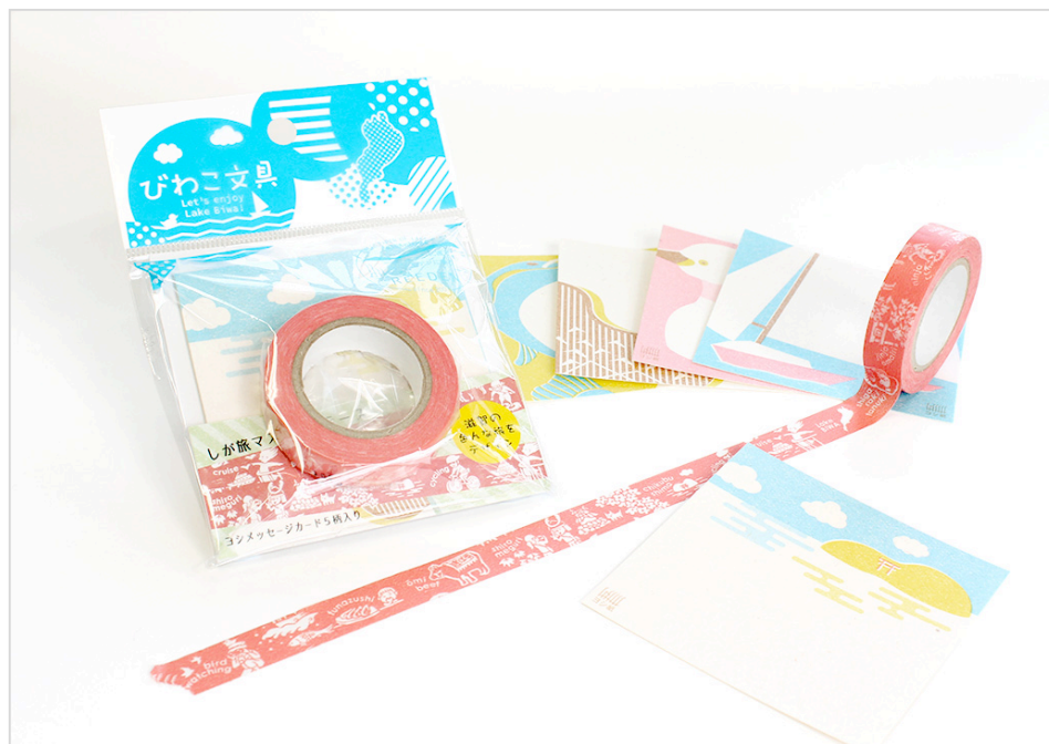
写真:「しが旅マスキングテープ」

(※)コクヨS&Tショーケース: http://www.kokuyo-shop.jp/shop