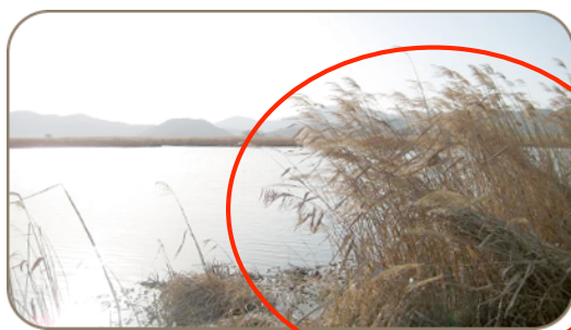
びわ湖のヨシ群落

両社はヘンケルジャパンのグリーンブランド「エッセンシティ」取扱いヘアサロン(関西地区限定、57店舗)を通じて、コクヨの環境に配慮した紙製品ブランド「ReEDEN(リエデン)」のヨシポケットメモ、ヨシ100%紙のオリジナル・メッセージカードなどを配布し、環境保全に対する意識を広める活動を行います。