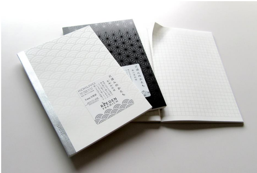
写真:「ノートブック〈ReEDEN PREMIUM〉 A6 表紙」

(※1)コクヨショーケース: http://www.kokuyo-shop.jp