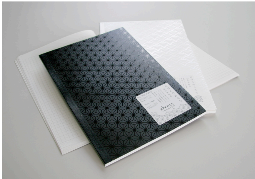
写真:「ノートブック〈ReEDEN PREMIUM〉 表紙」

(※1)コクヨショーケース: http://www.kokuyo-shop.jp